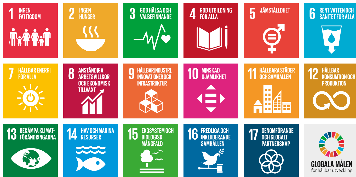
Agenda 2030 och de 17 globala målen för en ekonomisk, social och miljömässig hållbar utveckling.

Strategin beskriver hur Region Gävleborg, som organisation och vi som medarbetare, ska arbeta för att bidra till ett hållbart samhälle och utifrån vilka principer arbetet ska utföras för att säkerställa hållbar utveckling. Den ska fungera vägledande för Region Gävleborgs verksamheter, så att fastställda mål uppfylls med utgångspunkt i miljön, människan och ekonomi. Utöver Region Gävleborgs egna mål omfattas även nationella och regionala mål.